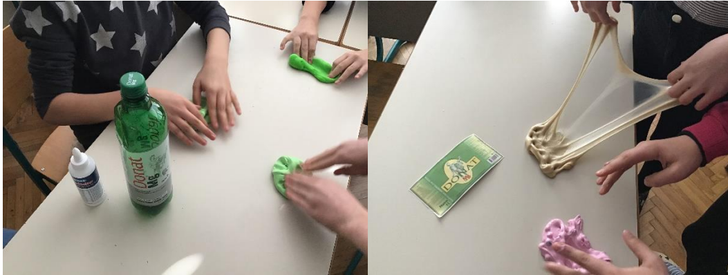
Slika 9: Izdelava slima

V posodo zlijemo natanko 100 g lepila. Dodamo dve kapljici Donata Mg, nato pa zmes dobro premešamo. Na koncu dodamo dve žlici Persila. Če ne želimo prozorni slime, lahko v zmes dodamo različna barvila. Vse skupaj še enkrat dobro premešamo in pustimo v posodi dve uri.