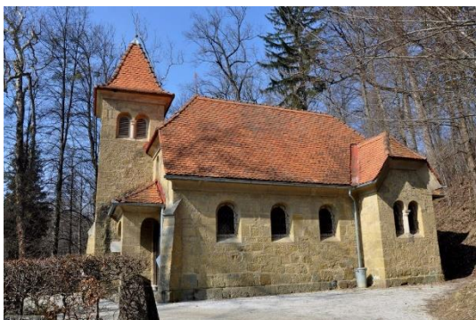
Slika 3: Kapela svete Ane

Kapela sv. Ane, ki jo zaznamujejo neoromanske oblike, je bila sezidana že leta 1804. Stoji na pobočju Tavčarjevega hriba. Zdraviliška kapela je posvečena sv. Ani, ki je poznana kot zaščitnica zdravilišča. Načrte za kapelo so naredili v Gracu. Leta 1686 je znani štajerski baročni mojster Hans Adam Weissenkirchner naslikal oltarno podobo sv. Marije z detetom in sv. Ane. Leta 1926 pa je kapelo sv. Ane preuredil znameniti slovenski arhitekt Jože Plečnik. Sv. Ana ponazarja svetovljanski odnos do zdravja in je že zaradi tega postala simbol zdravilišča. Na dan sv. Ane, ki je 26. julija, Rogaška Slatina praznuje občinski praznik.