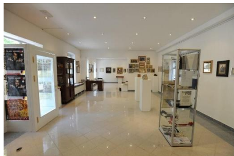
Slika 5: Notranjost Anine galerije

Anina galerija deluje od leta 2004, v njej pa svoja umetniška dela predstavljajo vrhunski domači in tuji umetniki.