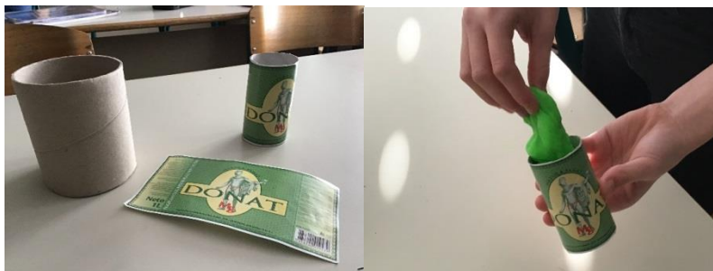
Slika 11: Pripomočki za embalažo

Za vsak tulec iz kartona izrežemo dno in pokrovček. Vse tulce namažemo z lepilom in nanje prilepimo etikete. Na pokrovček odtisnemo podobo svete Ane in ime turističnega spominka.