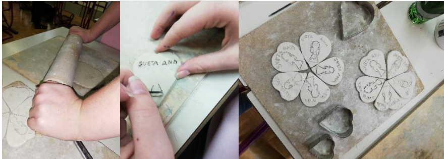
Slika 10: Izdelava Aninih src

Najprej pripravimo orodje in material, nato pa razgnetemo glino, da spravimo vodo in mehurčke iz nje. Glino z valčkom enakomerno razvaljamo na debelino 5 mm. Z modelčkom izrežemo kekse v obliki srca. V podlago odtisnemo obris svete Ane, ki smo ga izdelali iz linoleja ali pa sveto Ano z leseno palčico narišemo in oblikujemo. Po prvem žganju spominke glaziramo in jih damo ponovno žgat. Na končane izdelke prilepimo magnetke.