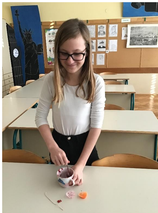
Slika 8: Izdelava sveče