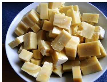
Slika 7: Koščki mila

Milo vzamemo iz modelčka in ga sušimo na časopisnem papirju. Vsakih nekaj dni ga je priporočljivo obrniti. Uporabljati ga lahko začnemo takoj, ko se strdi.