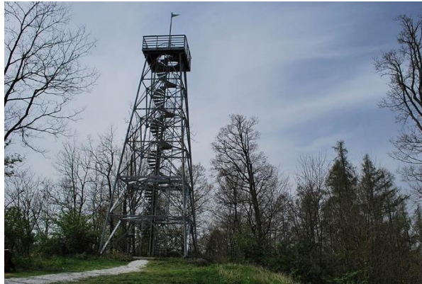
Slika 6: Stolp na Janini

Janina je 362 m visok grič nad Rogaško Slatino. Na vrhu je razgledni stolp, iz katerega se nam odpre razgled zlasti na zgornje in srednje Sotelsko gričevje, južna pobočja Boča in Donačko goro. Ime Janina izhaja iz imena Jana (Ana).